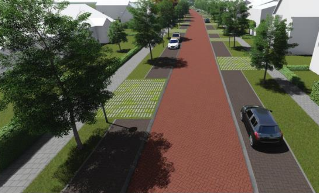
▲ Illustratie van de Annevillelaan zoals die er over ongeveer een jaar uit zal zien. © Gemeente Breda