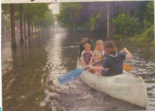
Het regent pret en chagrijn

In Ulvenhout viel afgelopen zaterdagavond - 5 juni - zoveel water uit de hemel dat de straten in rivieren veranderden en de kinderen met een kano op de Annevillelaan konden varen. Maar...er braken ook dakgoten af en keiders liepen onder.