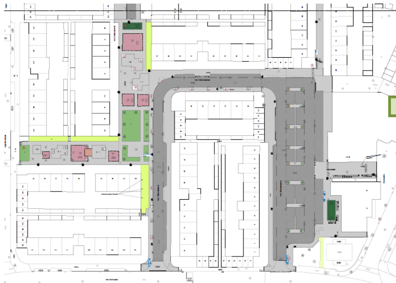
Oude situatie Van Tetterodestraat